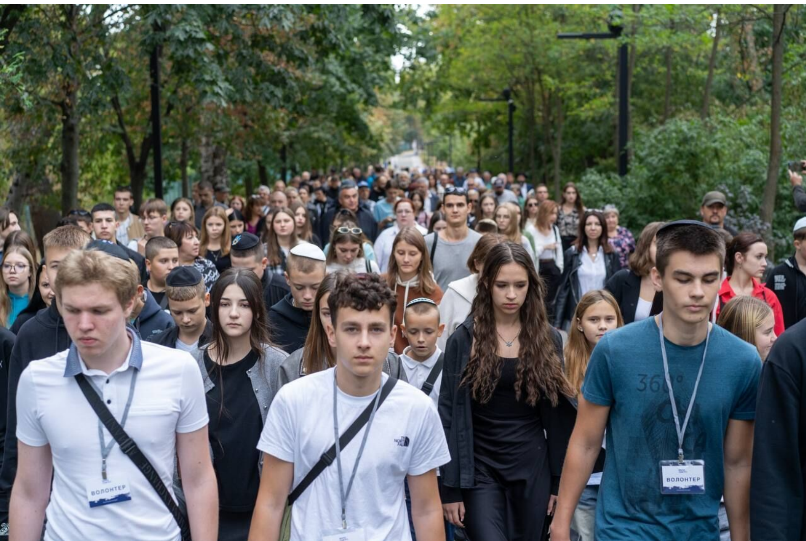
Marsz Pamięci