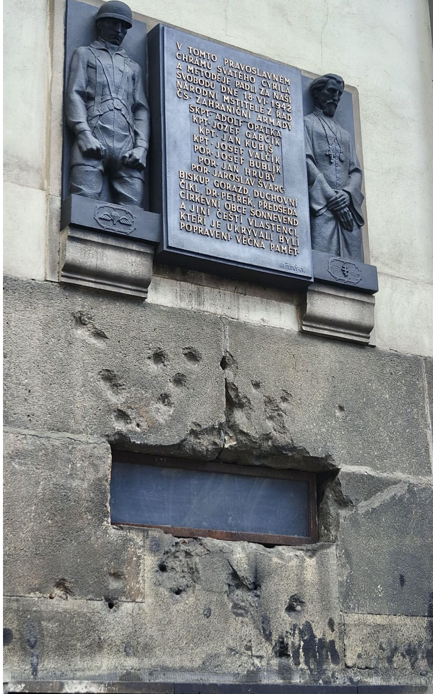
Dziury po kulach nad oknem krypty katedry świętych Cyryla i Metodego

który dominuje w pracach naukowych na temat epoki nazistowskiej 6 . Ta narracja sprawia, że tylko akty polityczne o charakterze publicznym – te dostępne dla mężczyzn sprawujących władzę – są uzasadnione jako opór.