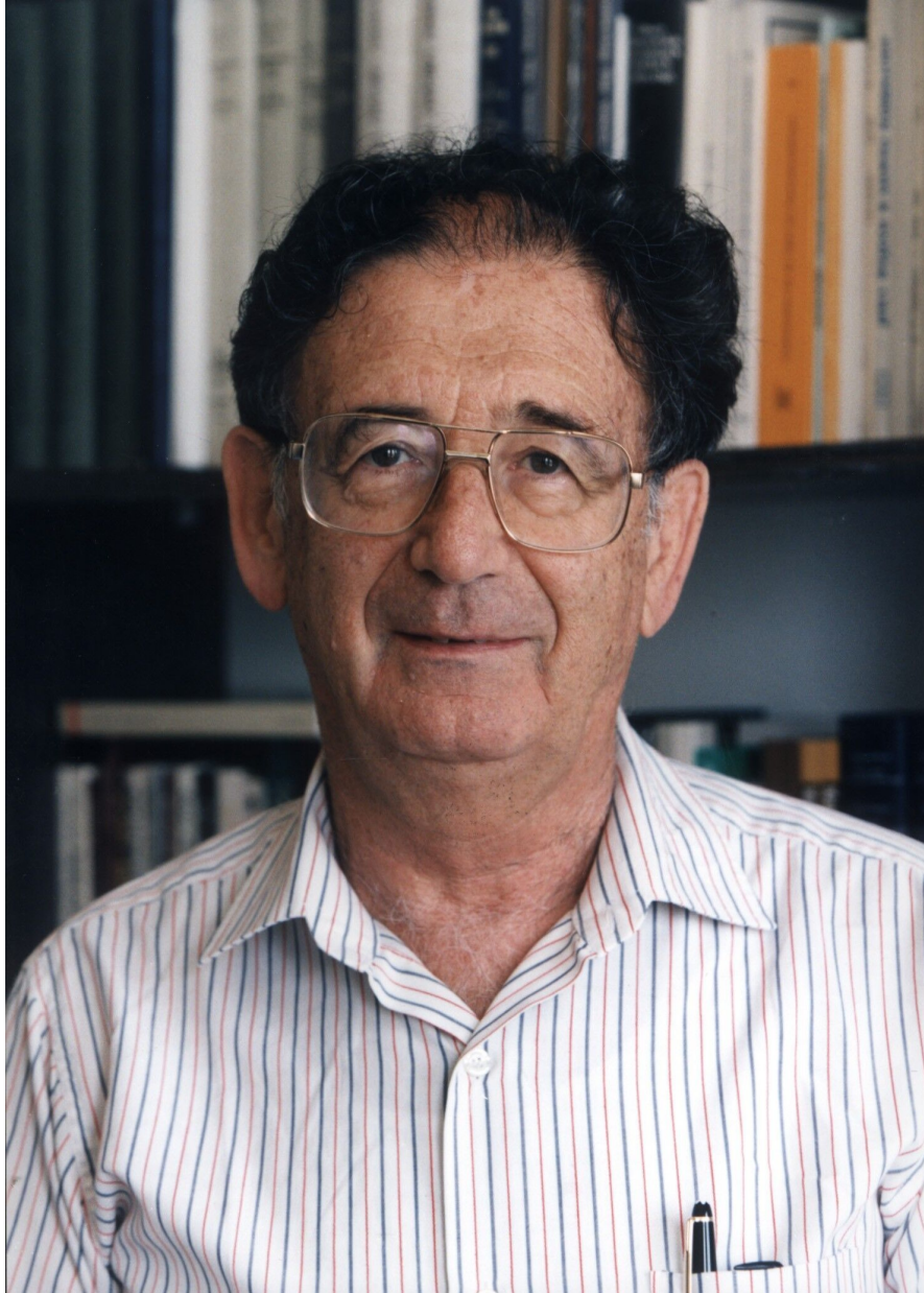
Prof. Yehuda Bauer

Urodzony w Pradze 6 kwietnia 1926 r. Profesor Bauer wraz z rodziną uciekł do Brytyjskiego Mandatu Palestyny przez Polskę i Rumunię po aneksji Czechosłowacji przez nazistowskie Niemcy w marcu 1939 r. Od najmłodszych lat Profesor Bauer poświęcił się badaniu historii. Po ukończeniu szkoły średniej w Hajfie otrzymał stypendium na studia na Uniwersytecie Cardiff w Walii, po czym wrócił do Izraela, aby kontynuować pracę magisterską na Uniwersytecie Hebrajskim, pisząc o Brytyjskim Mandacie Palestyny. Profesor Bauer wykładał w Instytucie Współczesnego Żydostwa na Uniwersytecie Hebrajskim i pełnił funkcję profesora wizytującego na Uniwersytecie Brandeis, Uniwersytecie Yale, Richard Stockton College i Uniwersytecie Clarka.