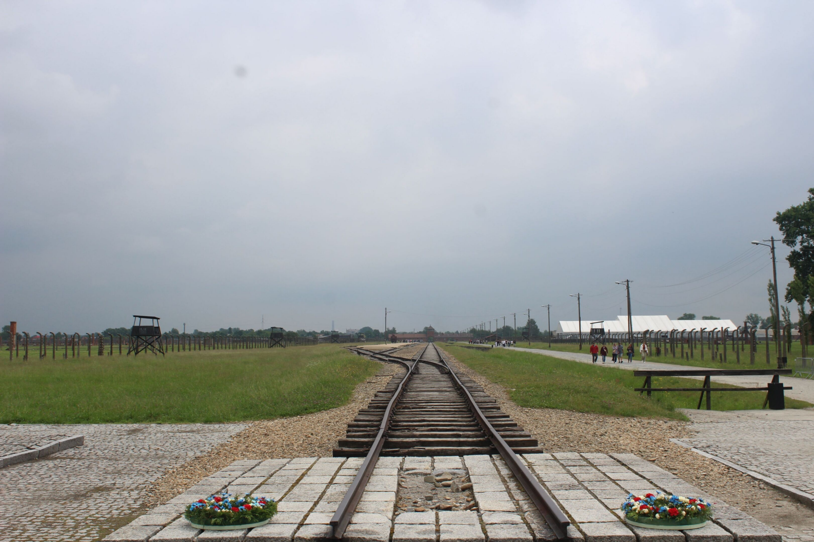
Tereny Auschwitz II-Birkenau.

Betonowe płyty tworzyły poszarpaną formę. Przez osiemdziesiąt lat uginały się, odkształcały, by następnie pęknąć pod własnym ciężarem, zapadając się w pustkę pod spodem. Zajął mi to chwilę, by zrozumieć, czym były: blokiem latryn. Tutaj więźniowie Birkenau byli zmuszani do załatwiania swoich potrzeb fizjologicznych, niezbędnych, by przetrwać. Strażnicy bili każdego, kto przebywałby tam zbyt długo. Kiedy próbowałem pojąć grozę, panującą w tym miejscu, zaskoczył mnie ruch.