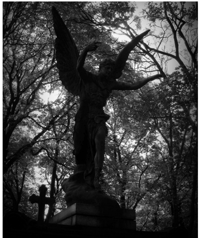
Cmentarz na Powązkach w Warszawie

Żałoba według tradycji trwała przeważnie rok. Dziś coraz więcej osób traktuje te wymogi bardzo indywidualnie. Coraz mniej osób, nawet tych z najbliższej rodziny, nosi czarny lub ciemny strój przez jakiś czas po pogrzebie. W rocznice śmierci zamawia się mszę za zmarłego.