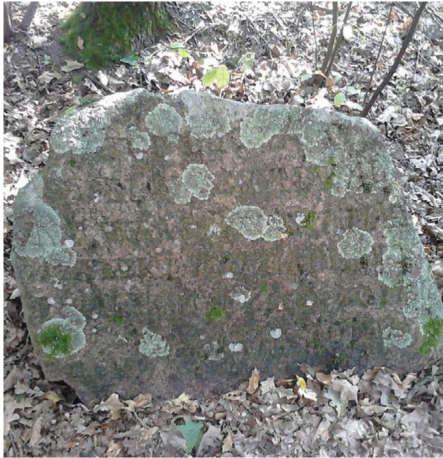
Lebiedziew. Cmentarz tatarski, nagrobek z polską inskrypcją.

W islamie nie ma wyznaczonych dni do odwiedzania zmarłych. Można każdego dnia przyjść i odwiedzić bliskich, by się pomodlić, ewentualnie uporządkować otoczenie grobu.