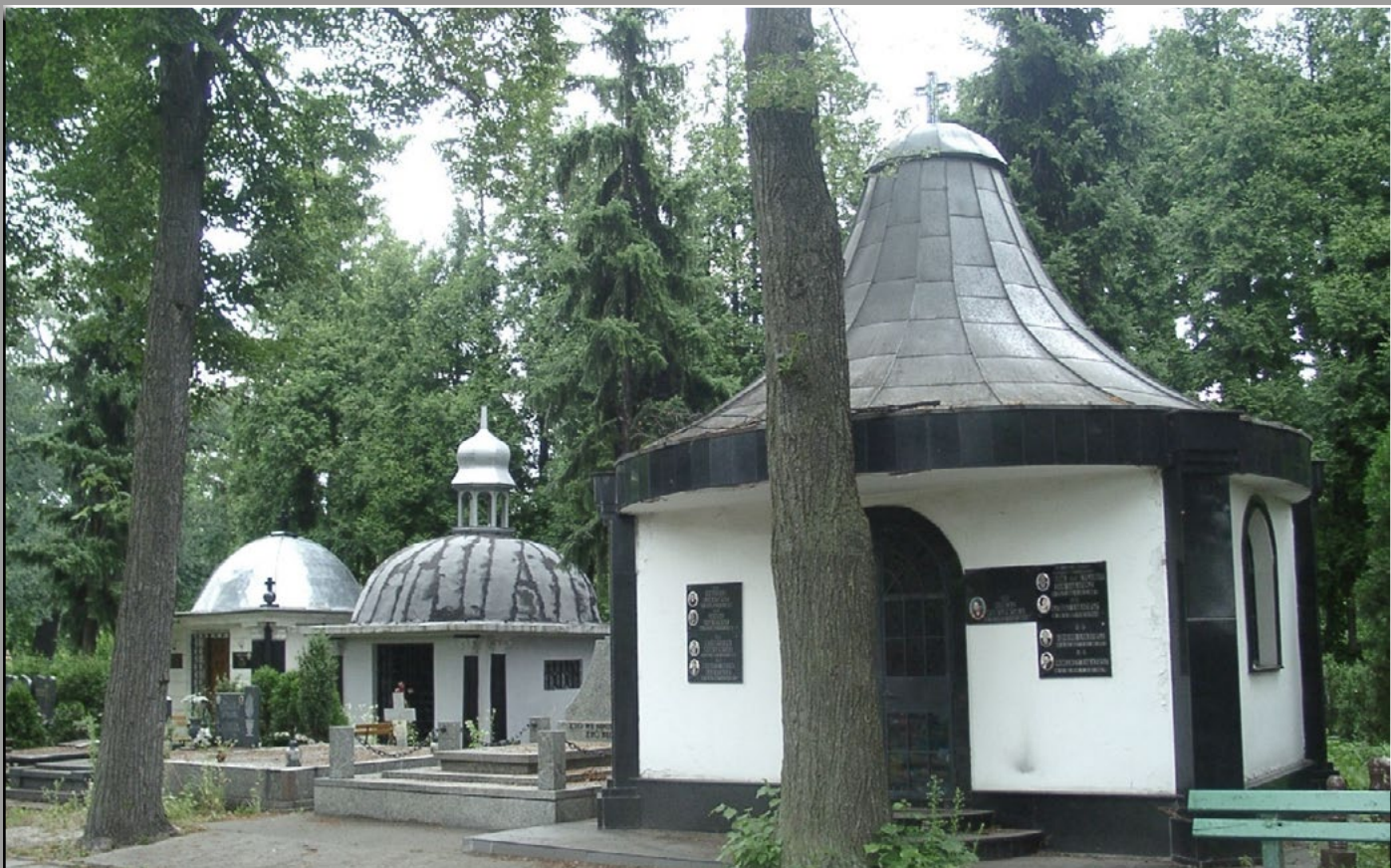
Cmentarz Komunalny we Wrocławiu przy ul. Osobowickiej.