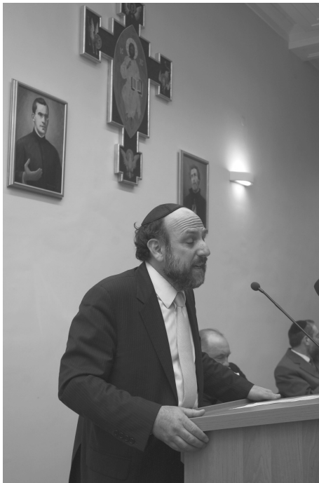
Naczelny rabin Polski Michael Schudrich wygłasza wspomnienie o Janie Pawle II.

kład czystej miłości i zrozumienia, że każdy człowiek jest dzieckiem Boga. Wszyscy znamy oczywiście tę prawdę. Jest jednak różnica między zrozumieniem tego na poziomie intelektualnym a tym, co ukazuje się na poziomie serca i w życiu. Jan Paweł II żył bardzo głęboko właśnie tą prawdą. Traktował każdego człowieka jako dziecko Boga. Kiedy myśli się w ten sposób, kontakt z ludźmi staje się niezwykle. Niezależnie od tego, czy rozmawia się z dzieckiem, czy z prezydentem — ta osoba czuje, że jest ważna.