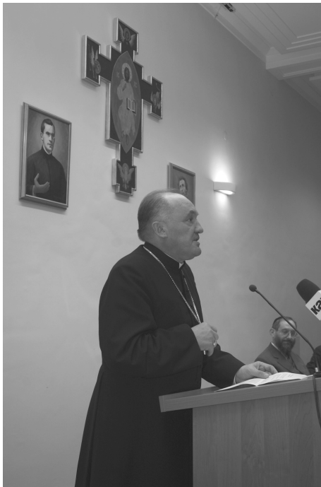
Metropolita warszawski abp Kazimierz Nycz wygłasza referat o stosunku Jana Pawła II do Żydów i judaizmu.

znajdowała się w pobliżu naszego gimnazjum. W oczach mam jeszcze szeregi wyznawców, którzy w dniu świątecznym udawali się do synagogi na modlitwę.