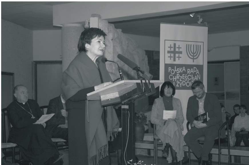
Prezydent Hanna Gronkiewicz-Waltz wygłasza chrześcijański komentarz do fragmentu Tory.

trzeba zauważyć, że cała misja powierzona Abrahamowi, której elementem były narodziny Izaaka, bez kobiety by się nie powiodła. Z jednej strony możemy powiedzieć, że niczego nie możemy uczynić bez Boga. Ale z drugiej — Bóg nie może niczego uczynić bez kobiety... Gdy goście zapytali Abrahama: „Gdzie jest twoja żona, Sara?”, odpowiedział: „W tym oto namiocie” (Rdz 18,9). Tak jakby nie zdawał sobie sprawy z tego, do czego jeszcze żona może mu się przydać. Okazało się jednak, że mimo swego wieku to właśnie ona może sprawić, aby ożyła obietnica, w którą Abraham już być może zwątpił. Chociaż skupiamy się tutaj nad tym jednym fragmentem Księgi Rodzaju, to trzeba pamiętać, że w Piśmie Świętym, szczególnie w Torze, jest bardzo wiele kobiet takich jak Estera, Rut i Judyta, bez których nie uratowałby się naród żydowski i bez których wola Boża nie mogłaby się w żaden sposób spełnić.