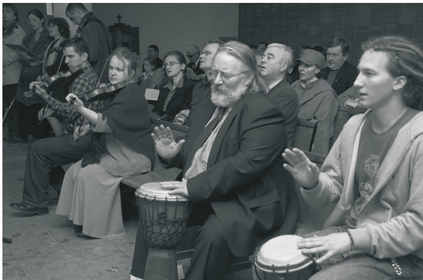
Muzycy z Drogi Neokatechumenalnej prowadzą śpiew psalmów.