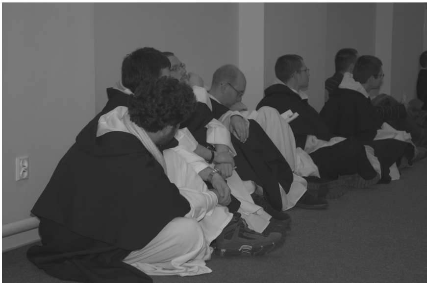
I w roku 2007, i w roku 2008 w auli PWT „Bobolanum” brakowało miejsc siedzących. Na zdjęciu: bracia dominikanie podczas sympozjum w roku 2008.