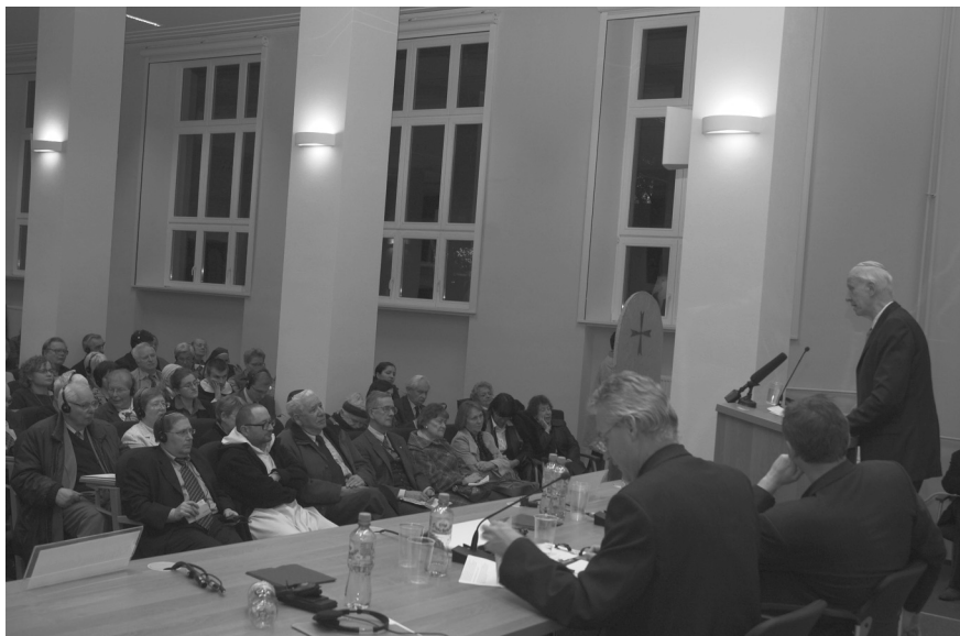
R. Irving Greenberg wygłasza referat o żydowskiej teologii chrześcijaństwa.

jak również kultywowanie obchodów minionych wydarzeń historycznych nie powinny już być wiążącym obowiązkiem. Zostały one uznane za dawne rytuały, zapowiadające wyższe duchowe praktyki chrześcijan i ich nowe znaczenie.