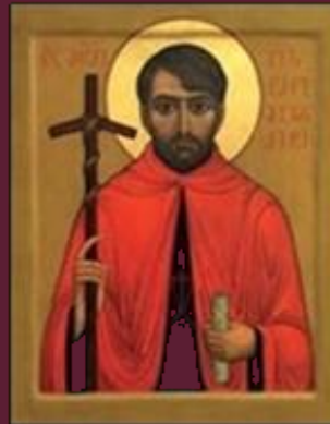
Grzegorz Peradze + 6.12.1942, Auschwitz