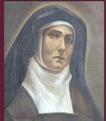
Edith Stein + 9.08.1942, Auschwitz-Birkenau