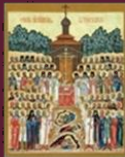
New Martyrs of Russia + 1937/38, Butovo