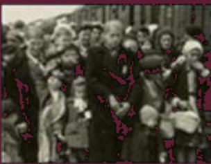
Jews from Hungary + 1944, Auschwitz-Birkenau