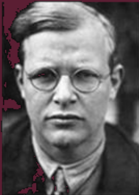
Dietrich Bonhoeffer + 9.04.1945, Flossenbürg